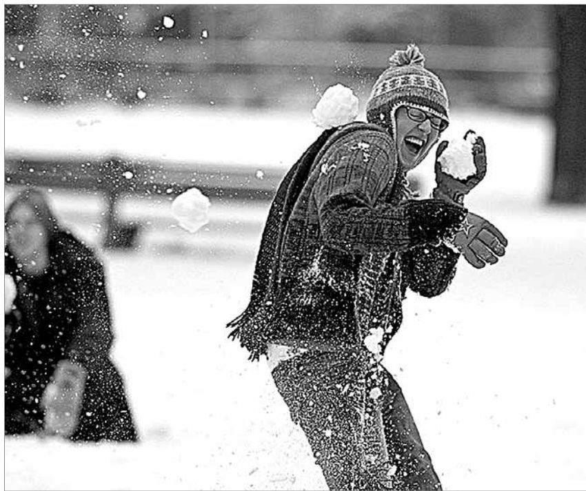
«Это пока псковичи кидают снежками друг в друга. А вот когда жить в сугробах станет невозможно, найдут новую мишень».

Участие городских властей в весенних субботниках уже стало традицией. Видимо, теперь пора вводить такую же практику зимой.