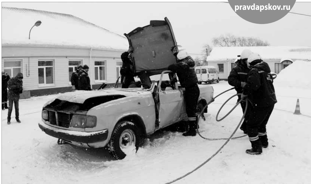
От умения спасателей виртуозно вскрыть машину как консервную банку иногда зависит жизнь ее пассажиров.

Условия соревнований приближены к обстановке при реальных дорожно-транспортных происшествиях. Звучит сигнал к началу, и спасатели, в составе команды из 4-х человек, приступают к выполнению своей непосредственной работы. За доли секунды им нужно оценить аварийную ситуацию (состояние транспортного средства и пострадавших), при помощи специальной техники и